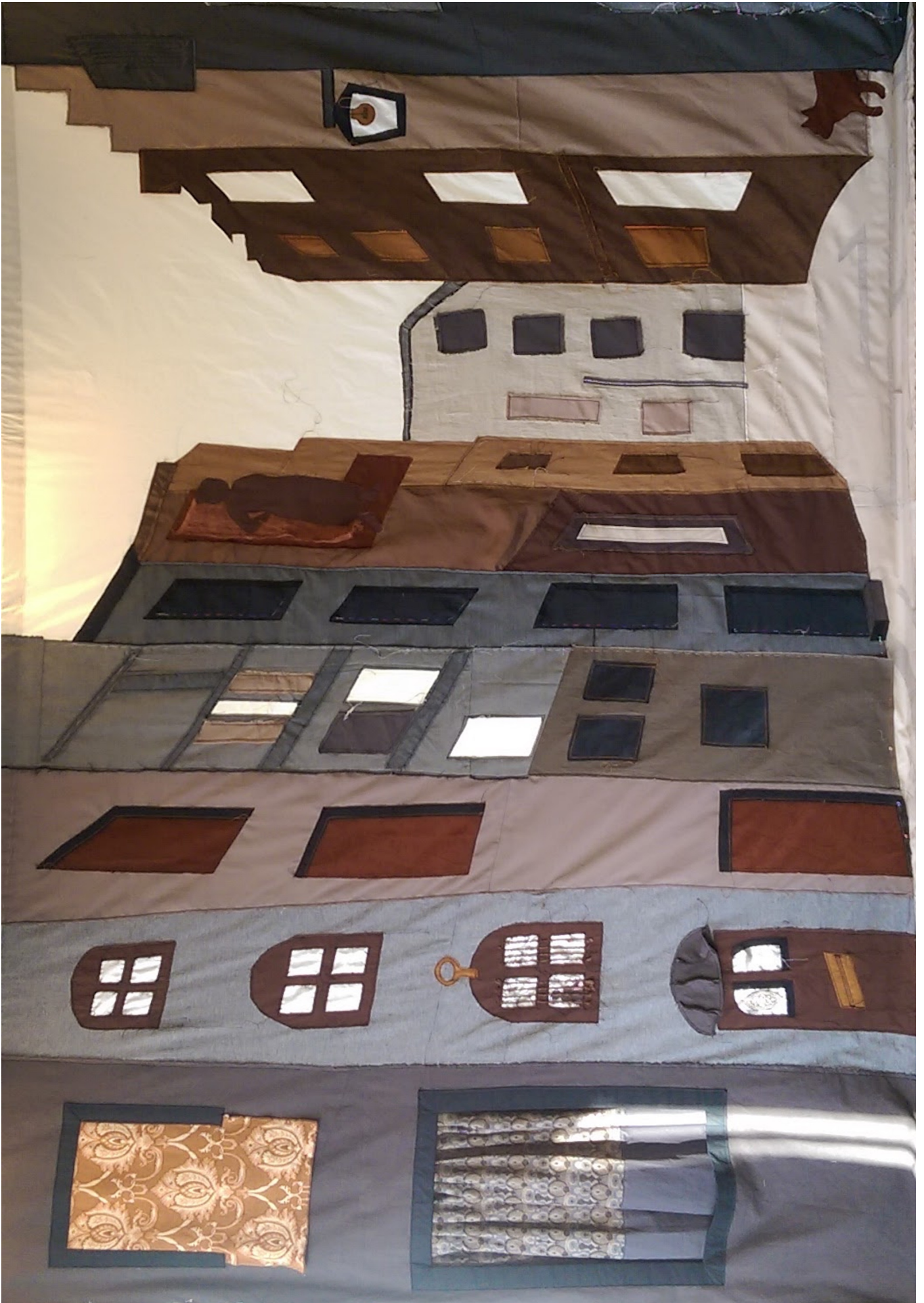
Afbeelding decor. Knutselopdracht.