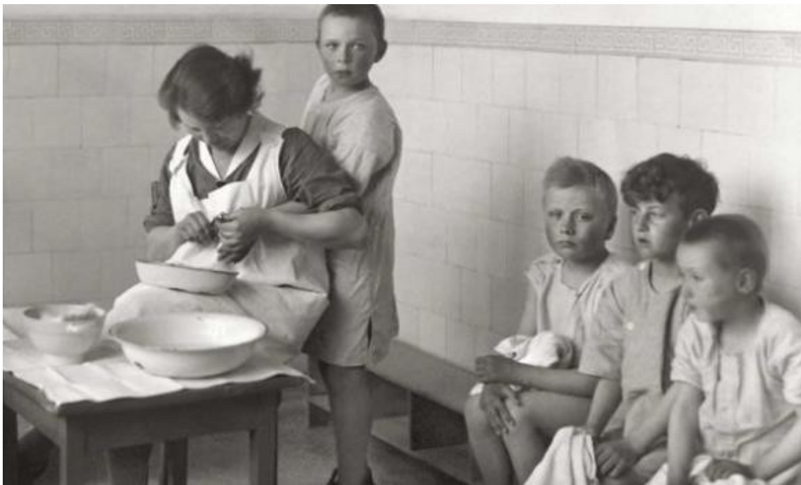
De Kinderkolonie, Nationaal Gevangenis­museum Veenhuizen

Structurele verbindingen vanuit het cultuurmenu met naschoolse cultuuractiviteiten, bijvoorbeeld via de activiteitenladder blijken nog lastig af te stemmen en organiseren. Op het gebied van het informele leren liggen kansen. De ontwikkeling van het individuele kind en het plezier moeten centraal staan.